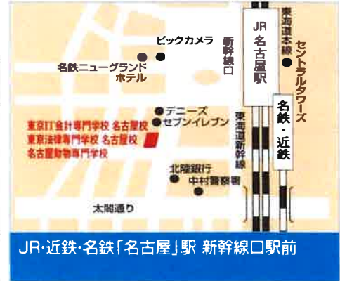
JR・近鉄・名鉄「名古屋」駅 新幹線口駅前